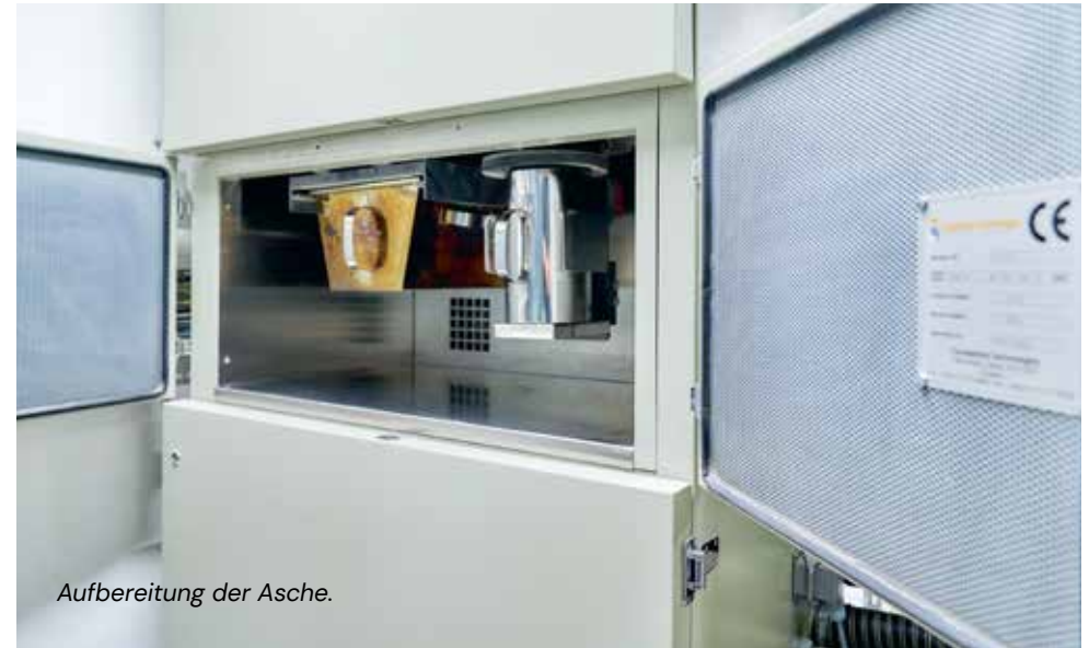
Aufbereitung der Asche.